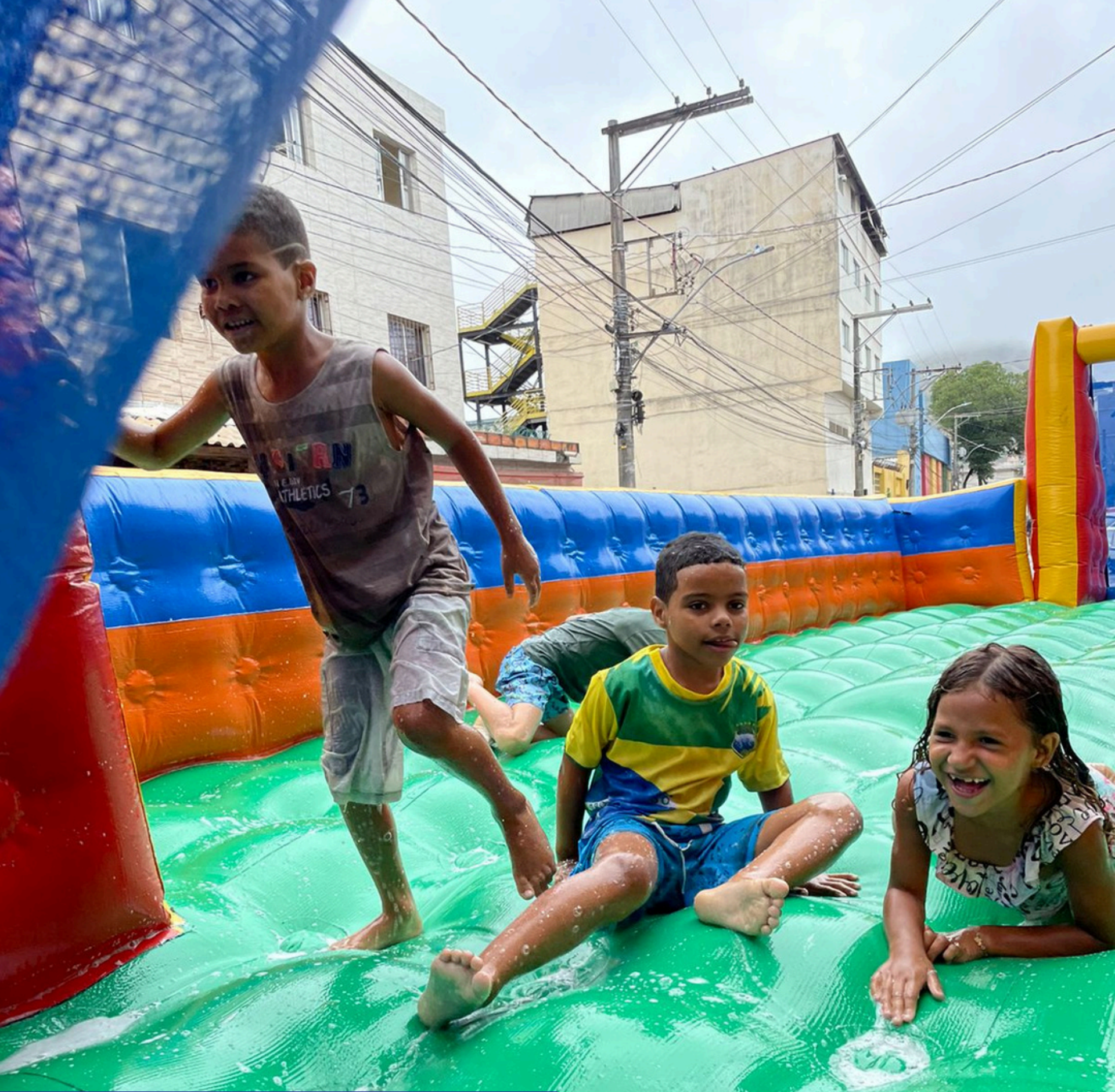
DIA DAS CRIANÇAS