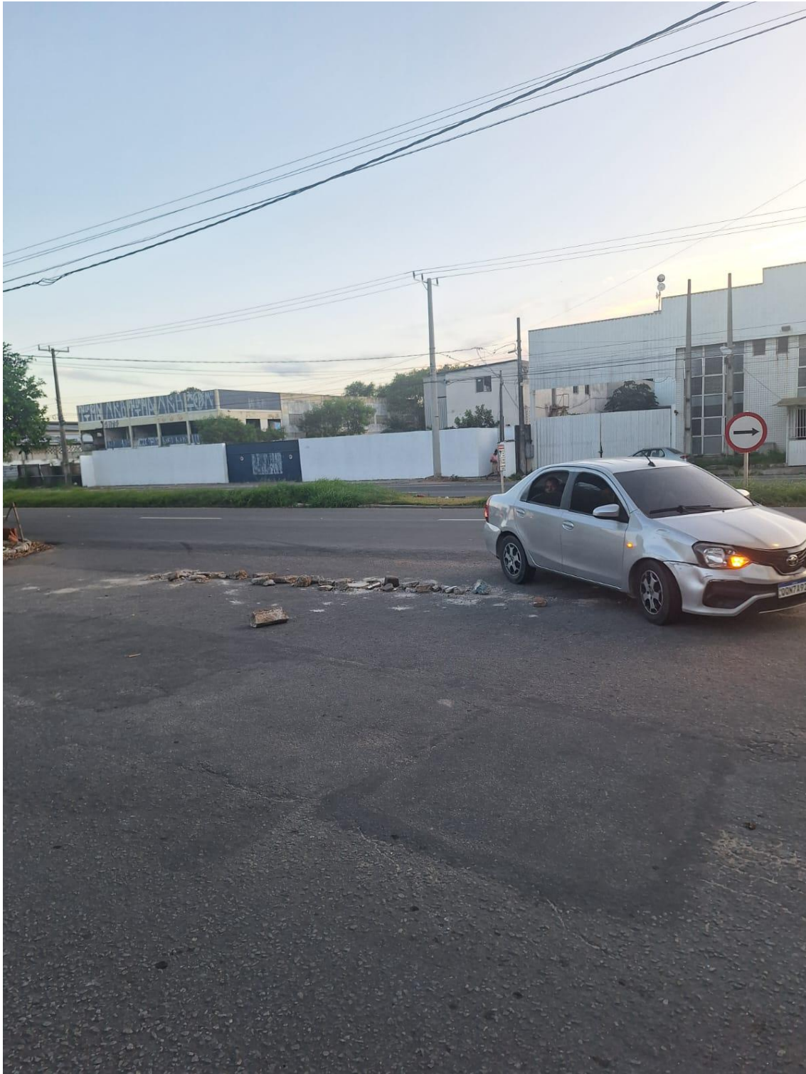
Tentativa dos moradores em conter o tráfego intenso de veículos pela via.